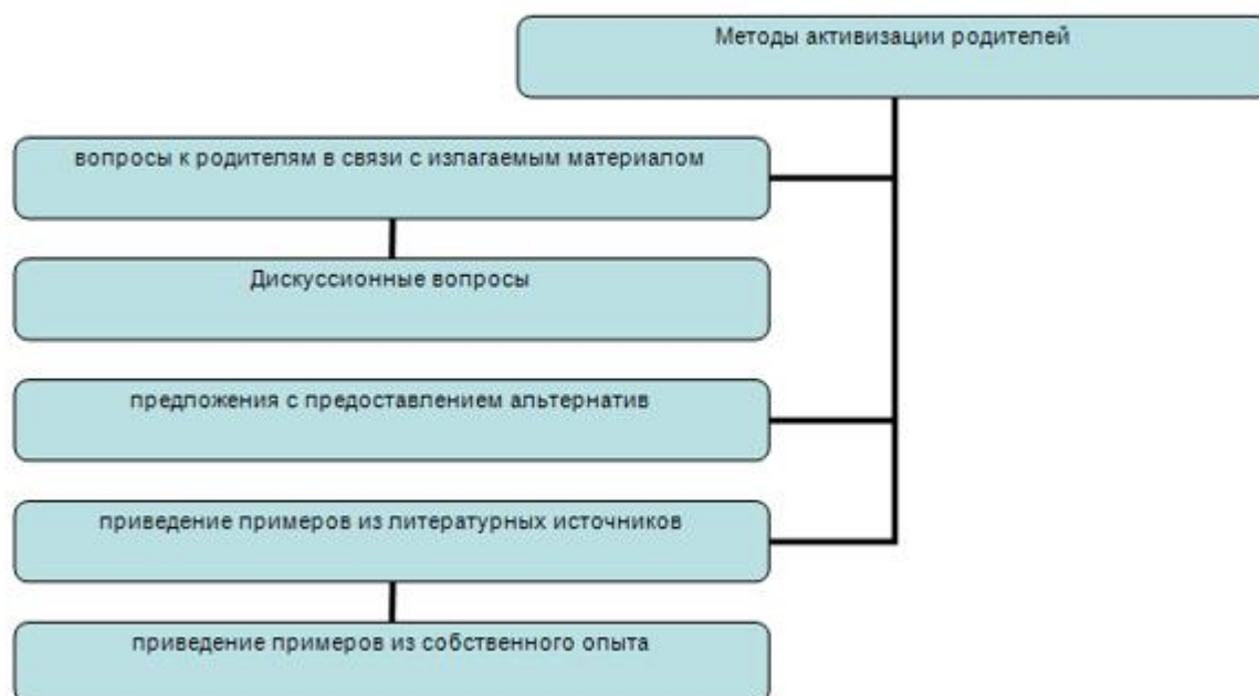
Схема. Методы активизации родителей

3 этап - формирование у родителей более полного образа ребенка и правильного его восприятия, включение родителей в образовательное пространство.